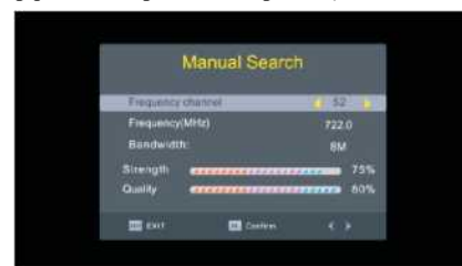
Интерфейсът на ръчното търсене (показан отдолу):

Бележка: Натискане ляво или дясно може да изберете честота на канал и отговарящата му честота, и диапазон, натиснете ОК за потвърждаване на търсенето, показани са силата на сигнала и качеството, натисни Exit за връщане назад.