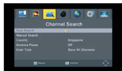
Интерфейсът на автоматичното търсене (показан отдолу):

Описание Търсене на сателитен сигнал ръчно или автоматично. Активни бутони и стъпки Влизане в Меню/Търсене на канали/Автоматично търсене, или Меню/Търсене на канали, Ръчно търсене, Натиснете ОК. OSD Дисплей